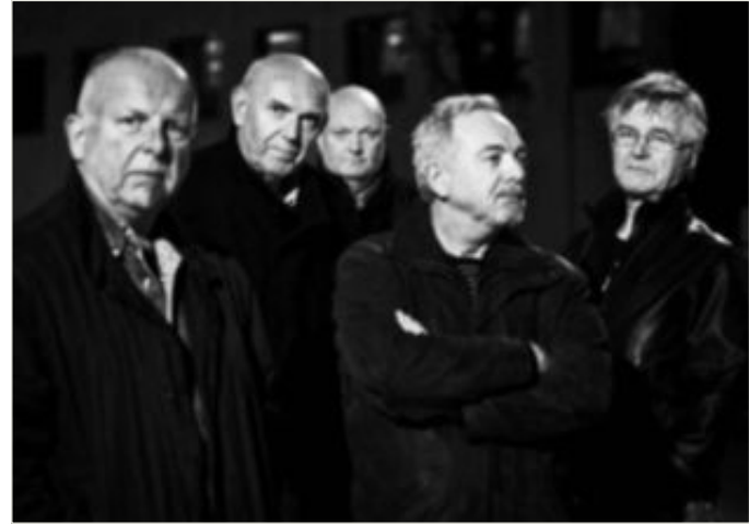
De Musikalske Dvergene.