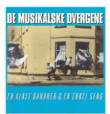
1989 - DMD

http://www.dvergene.no http://www.facebook.com/dvergene