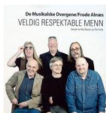
2004 - Tylden