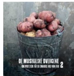
2016 - Grappa