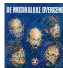
1990 - DMD