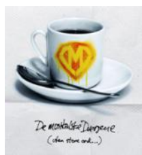
2008 - Stender