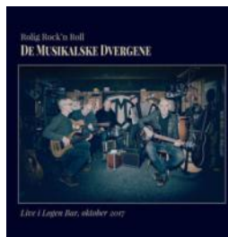
2017 - Grappa