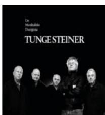
2012 - Grappa