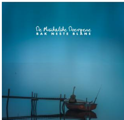
Ny plate: 2020 - Grappa